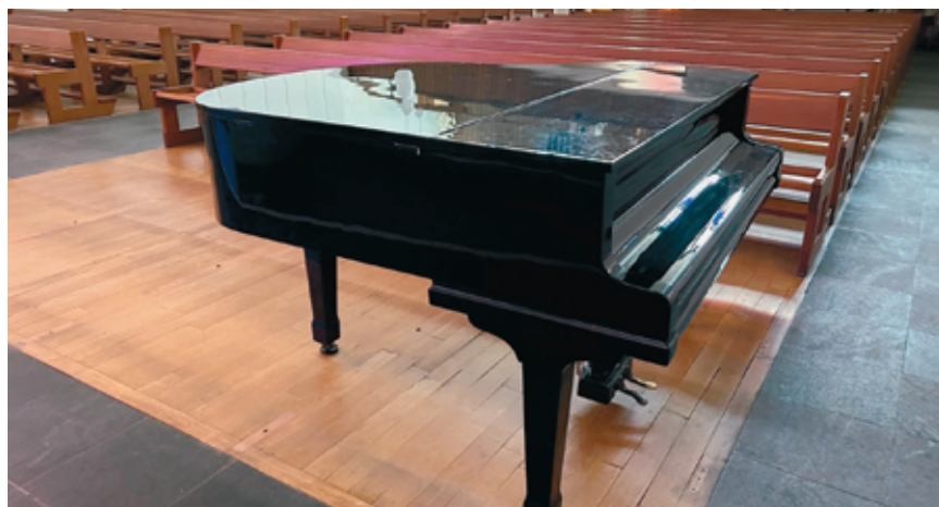
La clé qui rendra au piano sa voix et son sourire n'a pas été perdue.