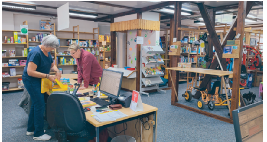
La Ludothèque de Boudry propose 2000 jeux.

Le 24 août dernier, la ludothèque a fêté ses 40 années d'activité. Dès mi-avril jusqu'aux vacances d'été, un concours a permis à de nombreux enfants de recevoir de très beaux et nombreux prix. Idem pour les concours du jour de l'anniversaire. Cette fête, avec collation, s'est déroulée par une belle journée au jardin de Voujeaucourt. Tous les participants sont repartis avec des souvenirs. A l'intérieur un bar à jeux faisait découvrir un large échantillonnage des jeux à emprunter. Au terme de ces 40 années qu'en est-