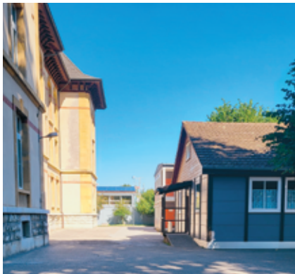
Le pavillon abritant la Ludothèque.